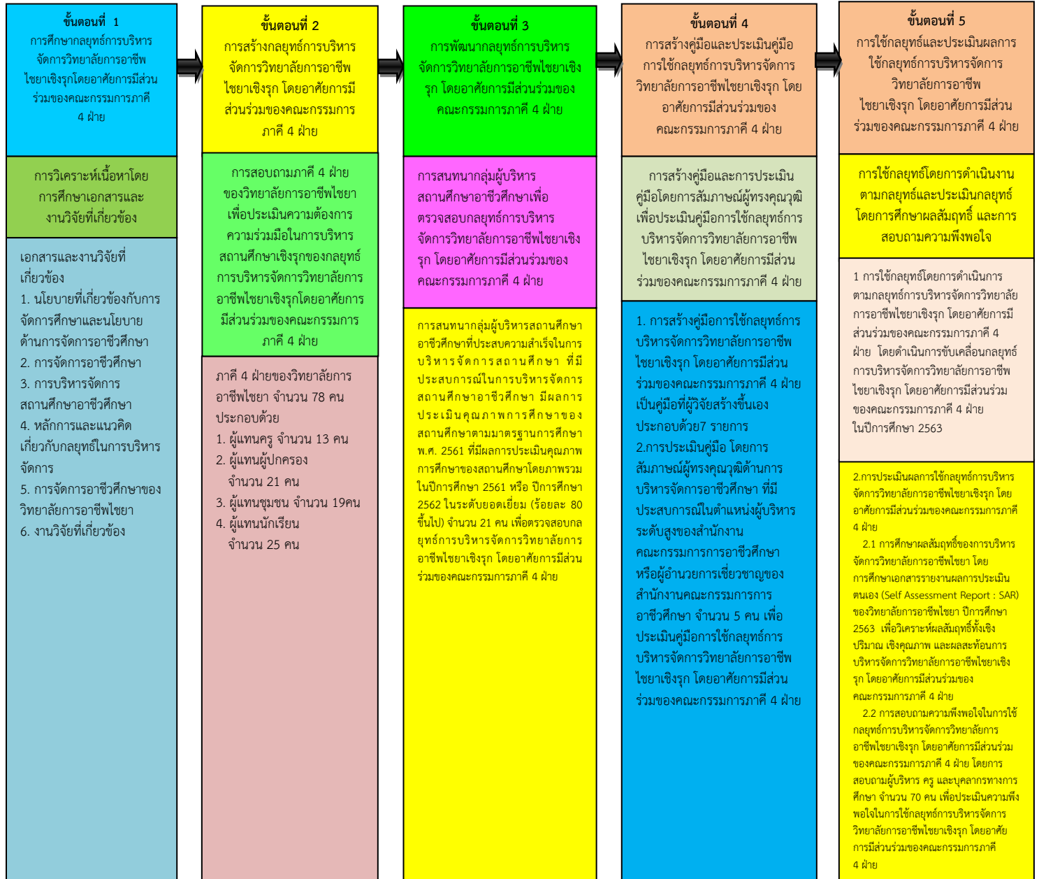
ภาพที่ 2 ขั้นตอนการวิจัยเรื่อง กลยุทธ์การบริหารจัดการวิทยาลัยการอาชีพไชยาเชิงรุก โดยอาศัยการมีส่วนร่วมของคณะกรรมการภาคี 4 ฝ่าย